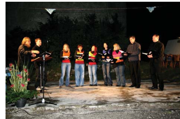
Vokalna skupina Jazzy.si