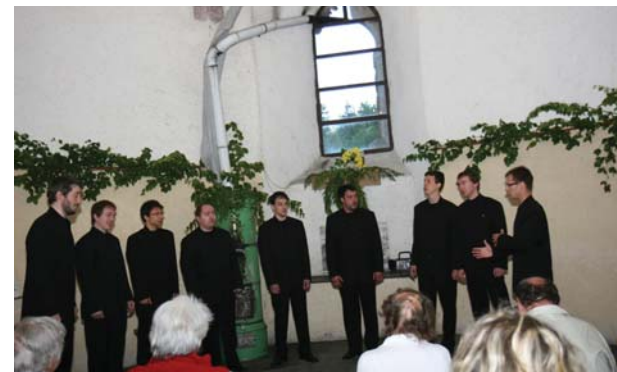
Vokalna skupina Goldinar