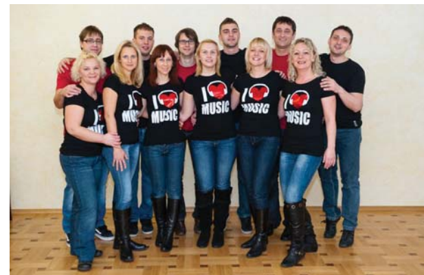
Vokalna skupina Expe