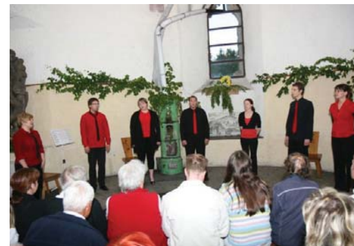
Vokalna skupina Jazzva