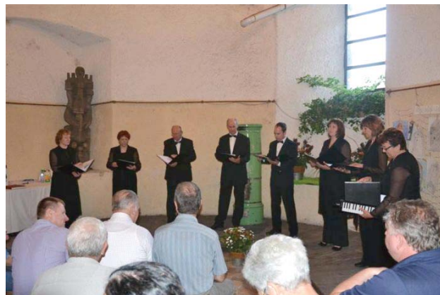
Pevska skupina Studenec