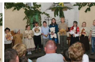
Otroška gledališka skupina Ščukice

JSKD RS je osim članom VS UNICA podeli Gallusove bronaste, srebrne in zlate značke za 5, 15 in 25 let udejstvovanja na področju ljubiteljske glasbene kulture. Čestitamo!