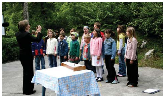
Podružnična OŠ A. Globočnika Planina