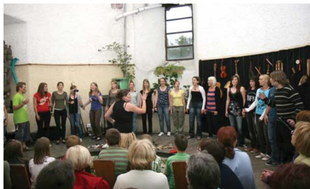
Pedagoška fakulteta Ljubljana