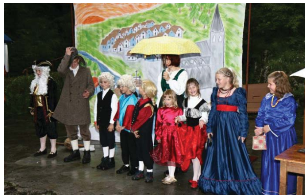
Otroška gledališka skupina Ščukice