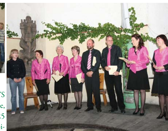
Dobitniki Gallusovih značk

JSKD RS je osim članom VS UNICA podeli Gallusove bronaste, srebrne in zlate značke za 5, 15 in 25 let udejstvovanja na področju ljubiteljske glasbene kulture. Čestitamo!