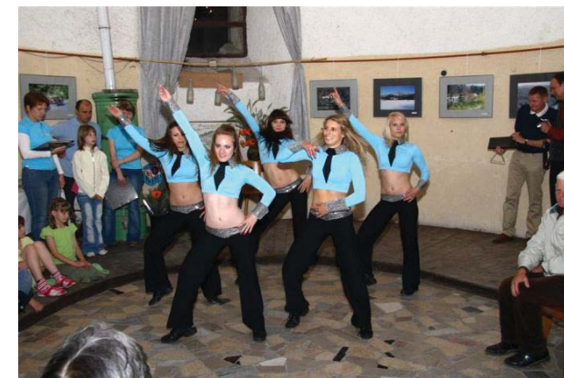
Plesni klub Tinča