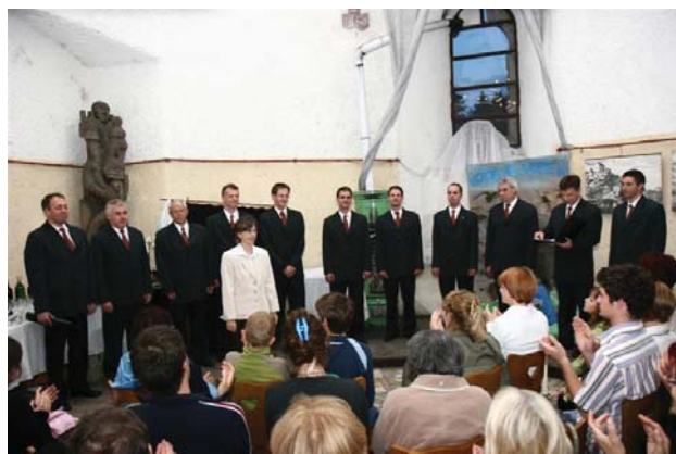
Vokalna skupina Slavna