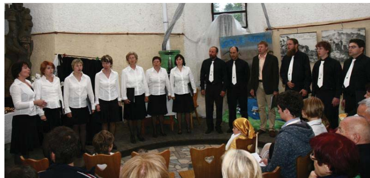
Vokalna skupina Unica