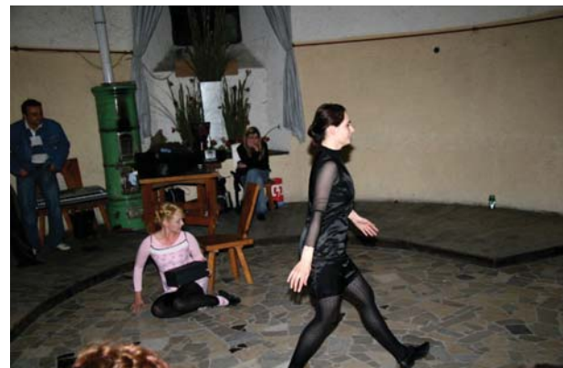
KUD Erato Izola