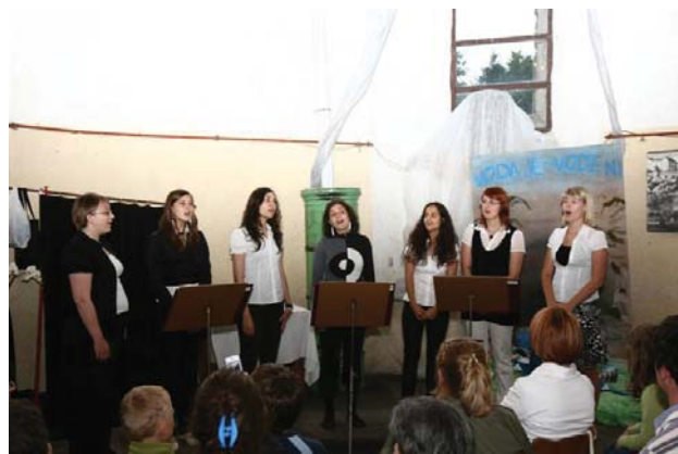
Vokalna skupina Aves