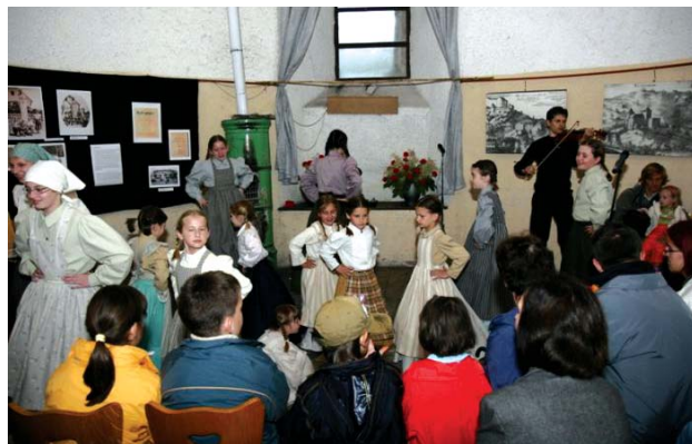
Kulturno društvo Otroci z Majlonta