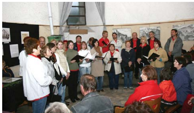
Mešani pevski zbor Šentviški zvon

V Planini se je v soboto 14. junija 2008 odvil še en Ravbarjev večer, ki je vztrajne in glasbenih doživetij željne obiskovalce popeljal v svet Miroslava Vilharja, njegovih samospelov, zborovskih skladb, dram in prebujanja narodne zavesti. Pred 190. leti se je namreč v Planini rodil pesnik, ki je prav v svoji rojstni vasi postavil prvo čitalnico na Notranjskem! V njej je začela kulturna dediščina notranjskega glasbenega