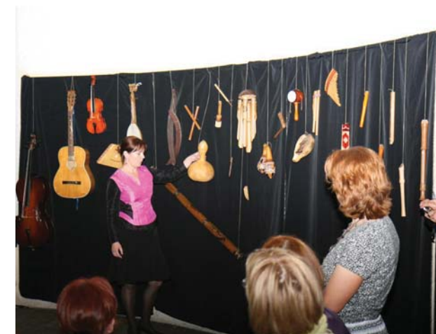
Razstava Inštrumenti gozdov