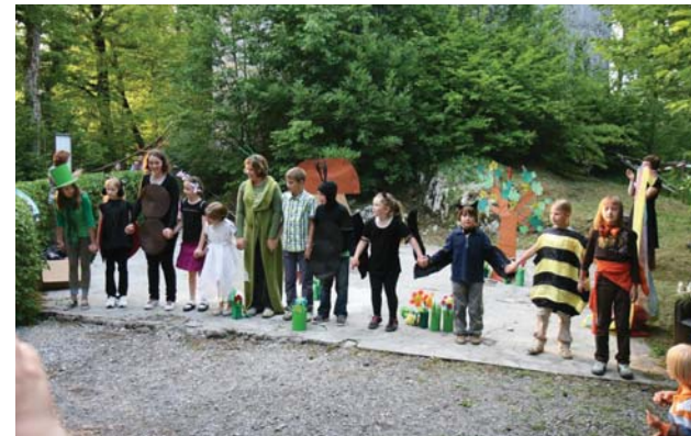
Otroška gledališka skupina Ščukice