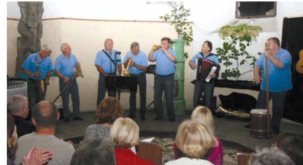
Kerglci izpod Ahca

Glasbeno prireditev pod geslom Sine musica nulla vita , smo ob Mednarodnem letu gozdov naslovili Pesem gozdov. Celoten program prireditve je potekal v duhu ohranjanja ljudskega izročila povezanega z gozdom. Tradicijo v prepletanju s sodobnejšimi trendi smo spremljali v igri, pesmi, instrumentalni izvedbi in z izdelki domače ter umetne obrti. Vpliv gozda na glasbeno ustvarjanje smo podprli s priložnostno razstavo inštrumentov, ki nam jih je podaril gozd. Tako si je bilo moč ogledati mnoge lesene inštrumente in zvočila iz Slovenije in celo iz drugih celin.