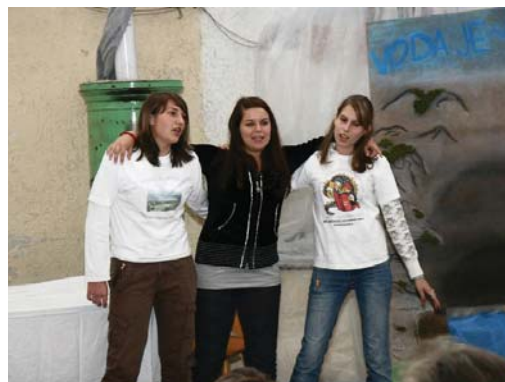
OŠ A. Globočnika Postojna in podružnica Planina