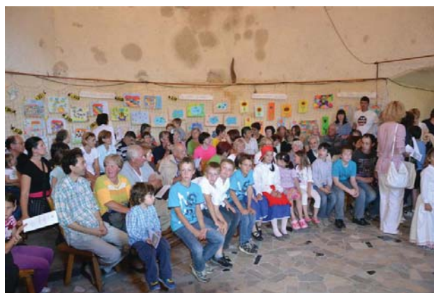
Razstava likovnih del učencev