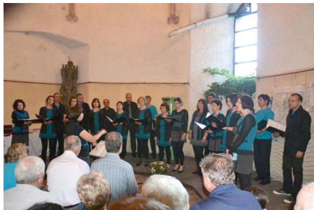
Komorni zbor Musica Viva