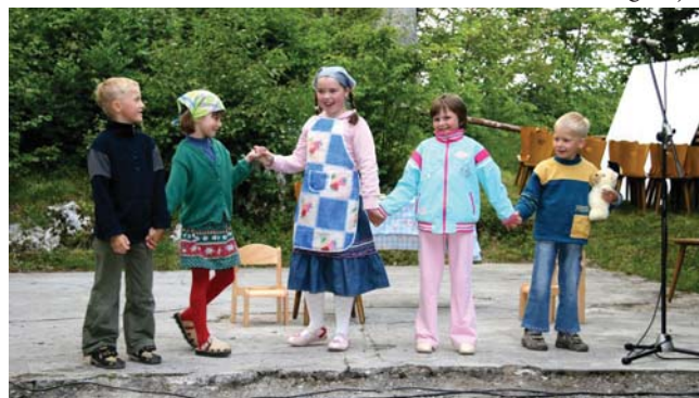
Otroška gledališka skupina Ščukice