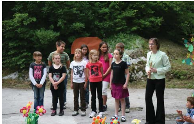
Podružnična OŠ A. Globočnika Planina