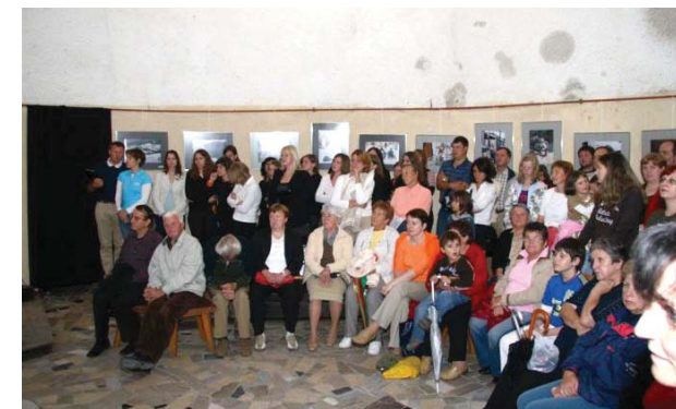
Razstava in publika