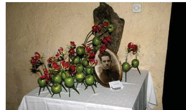
Utrinek z razstave