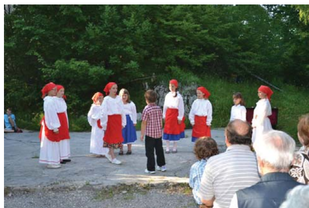
Podružnična OŠ A. Globočnika Planina