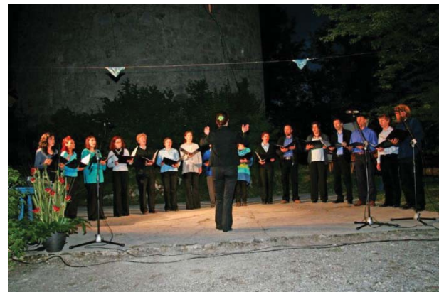
Pevski zbor Planina