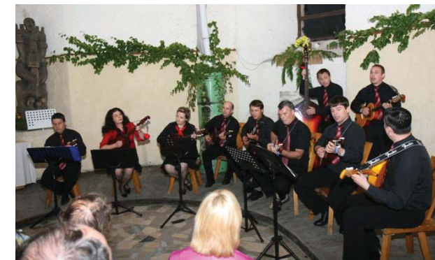
Tamburaški orkester Trnice