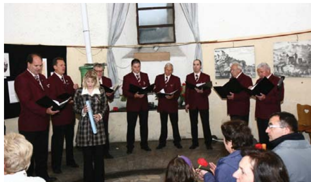
Moški pevski zbor Košana