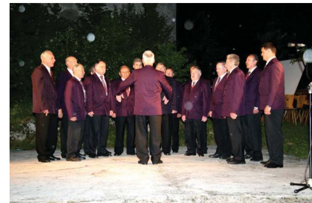
Moški pevski zbor Tabor Cerknica