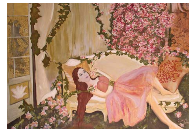
Catherina Zavodnik: V mesečini češnjevih cvetov (2010) olja na lesu 100x150; Opus: Zapozneli ples z Raffaellom