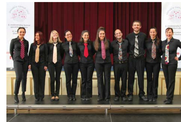
Mešana vokalna skupina Nešpula