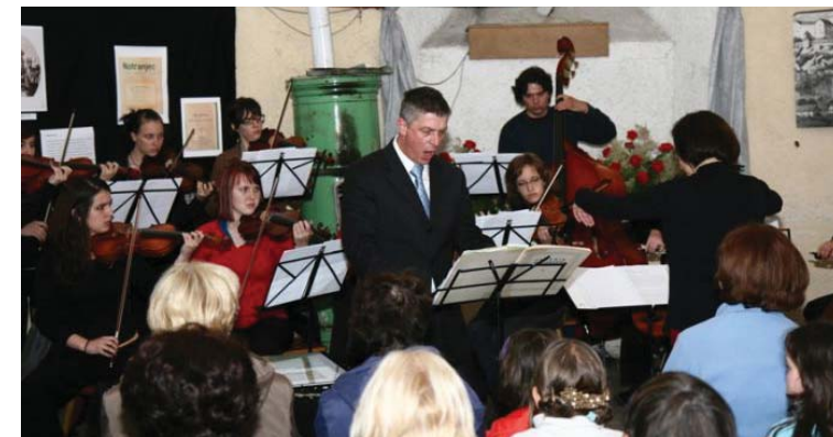
Godalni orkester GŠ Postojna