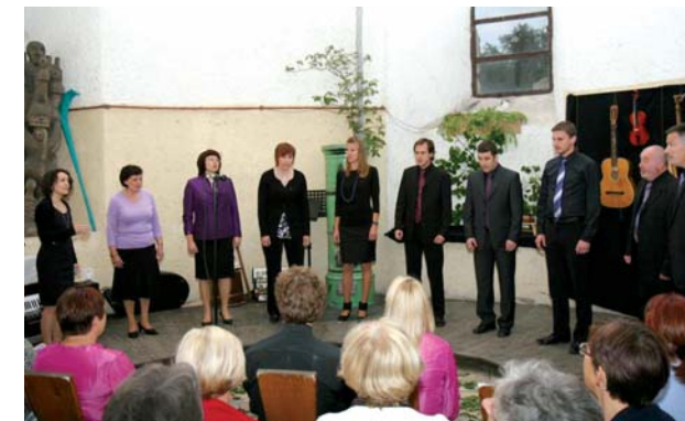
Vokalna skupina Grič