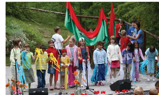
Podružnična OŠ A. Globočnika Planina