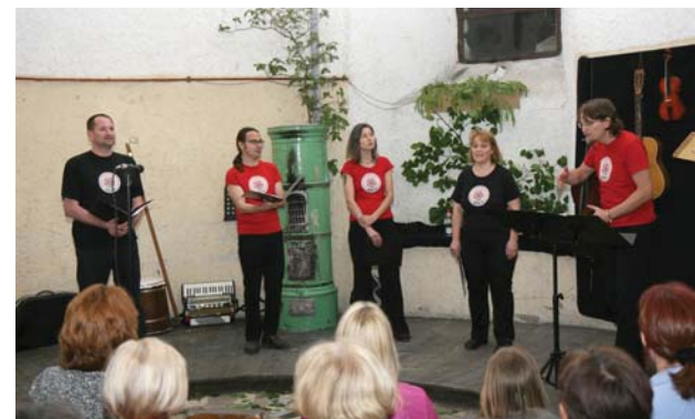
Vokalna skupina Jazzy.si

Glasbeno prireditev pod geslom Sine musica nulla vita , smo ob Mednarodnem letu gozdov naslovili Pesem gozdov. Celoten program prireditve je potekal v duhu ohranjanja ljudskega izročila povezanega z gozdom. Tradicijo v prepletanju s sodobnejšimi trendi smo spremljali v igri, pesmi, instrumentalni izvedbi in z izdelki domače ter umetne obrti. Vpliv gozda na glasbeno ustvarjanje smo podprli s priložnostno razstavo inštrumentov, ki nam jih je podaril gozd. Tako si je bilo moč ogledati mnoge lesene inštrumente in zvočila iz Slovenije in celo iz drugih celin.