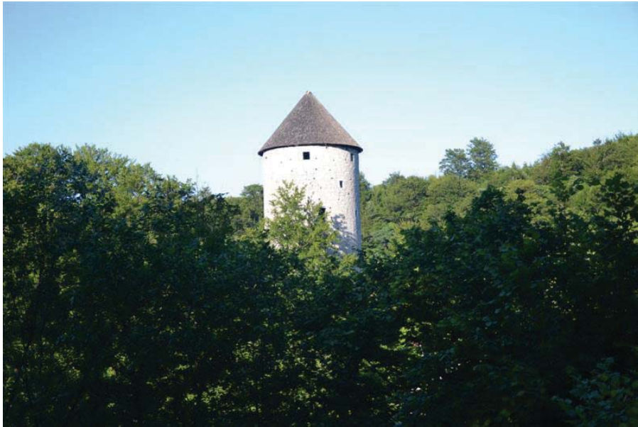
Ravbarjev stolp – Mali grad

Republika Slovenija Ministrstvo za kulturo Register nepremične kulturne dediščine