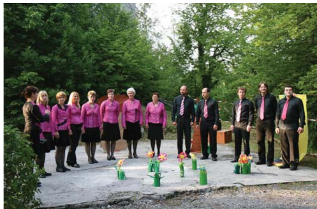
Vokalna skupina Unica