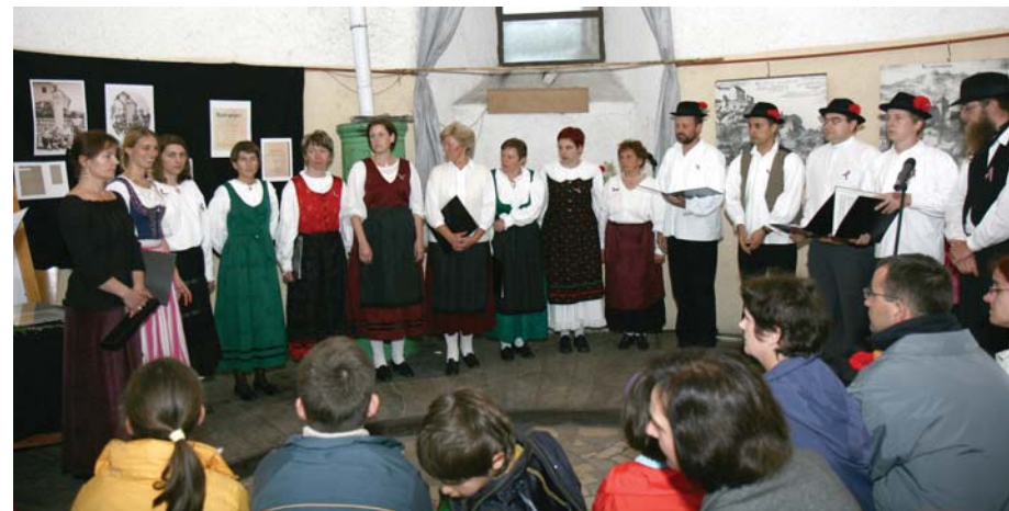
Pevski zbor Planina